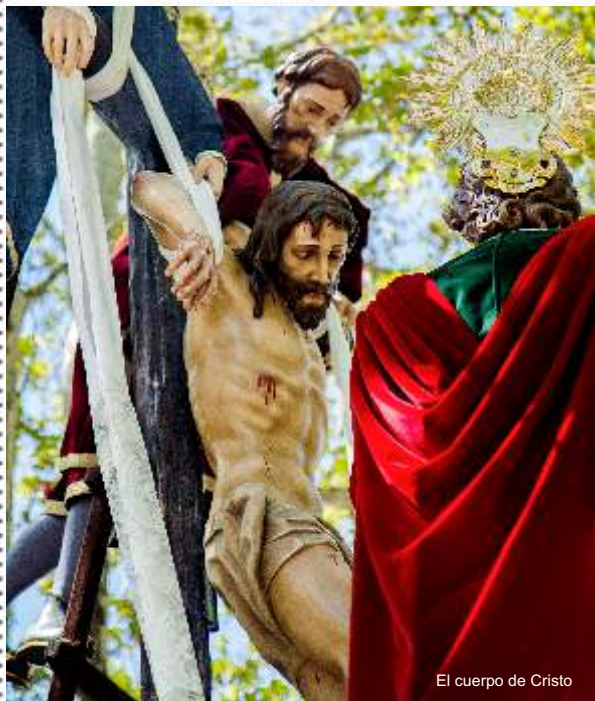
El cuerpo de Cristo