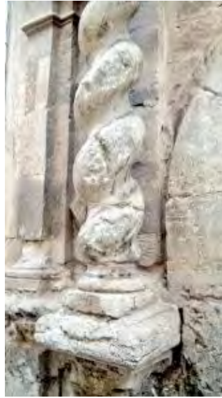
Mal de la piedra. Informe cultura (1986)