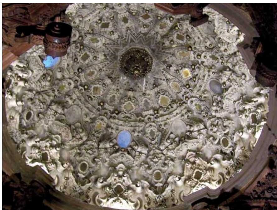
Magnífico camarín barroco.

En la pág. 60 v. de dicha guía se afirma que: “supone uno de los máximos exponentes de los desarrollos decorativos setecentistas en la provincia, comparable el camarín de la Virgen del Rosario de Granada”. GUÍA ARTÍSTICA DE GRANADA Y SU PROVINCIA (II). Fundación José M. Lara. (2006). (ANEXO-5).